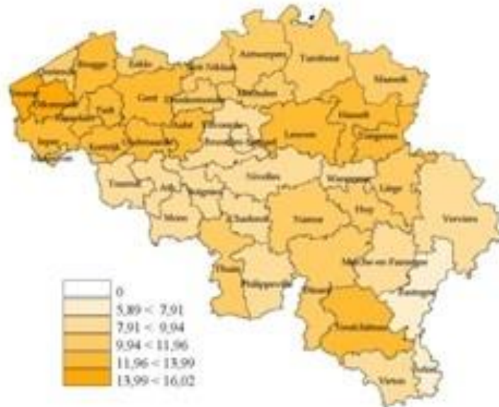
Kaart 2. Aantal gepresteerde VTEs door de huisartsen actief in de gezondheidszorg (PR), per 10.000 inwoners volgens arrondissement van activiteit, 31/12/2016